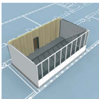
Mobile absorbenter monteres