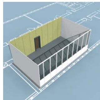
Fast absorptionsunderlag monteres