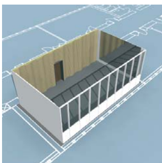
Spejle og tavler monteres