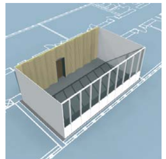
Bølgende træbeklædning opstilles.